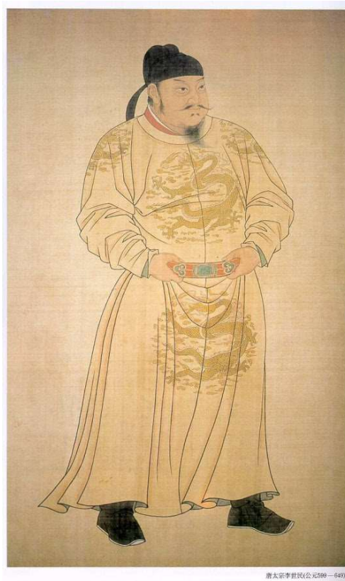
<당태종 이세민 초상 : 출처 조선일보 기사>

http://premium.chosun.com/site/data/html_dir/2013/11/10/2013111001796.html